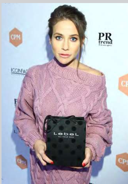
Юлия Барановская – телеведущая и писательница