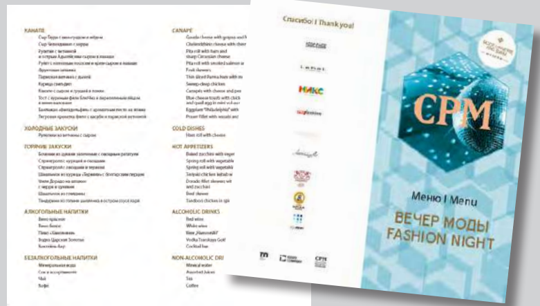
Пример меню клуба