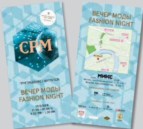
Пример пригласительного билета