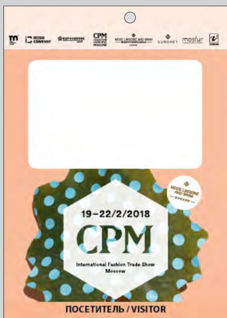
Пример лицевой стороны