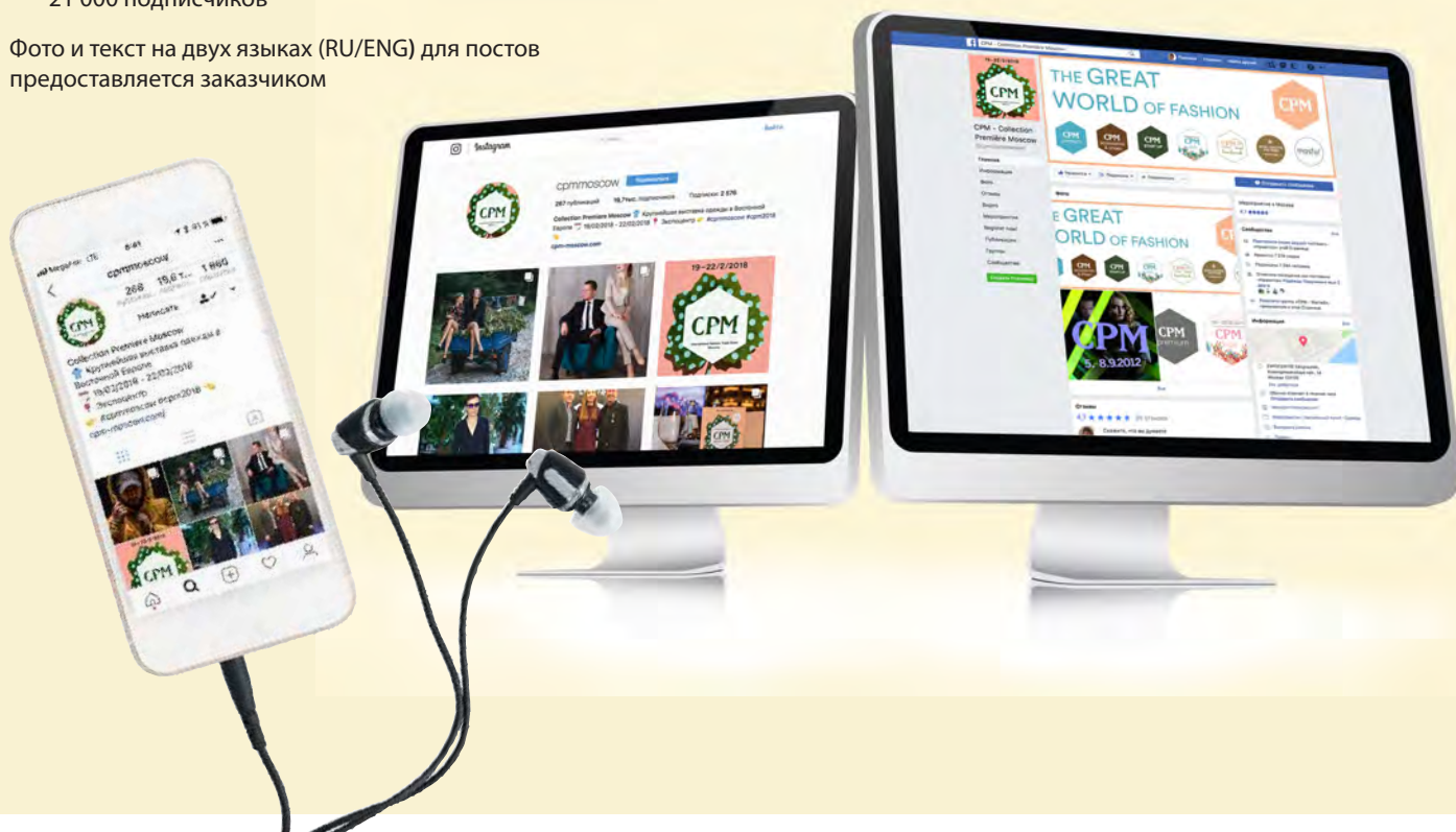
Фото и текст на двух языках (RU/ENG) для постов предоставляется заказчиком