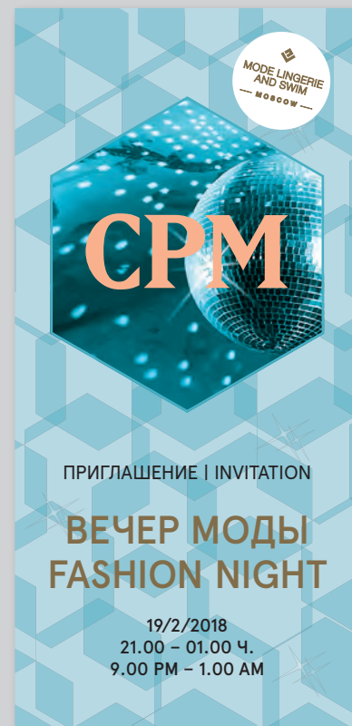
Пример пригласительного билета

Организатор: ООО «Мессе Дюссельдорф Москва», Ул. Тимура Фрунзе, 3, стр. 1, 119021, Москва Соорганизатор: Igedo Company GmbH & Co. KG, Emanuel-Leutze-Straße 8 | 40547 Düsseldorf, Germany T +49 (0)211/4396-379, F +49 (0)211/4396-345, cpm@igedo.com