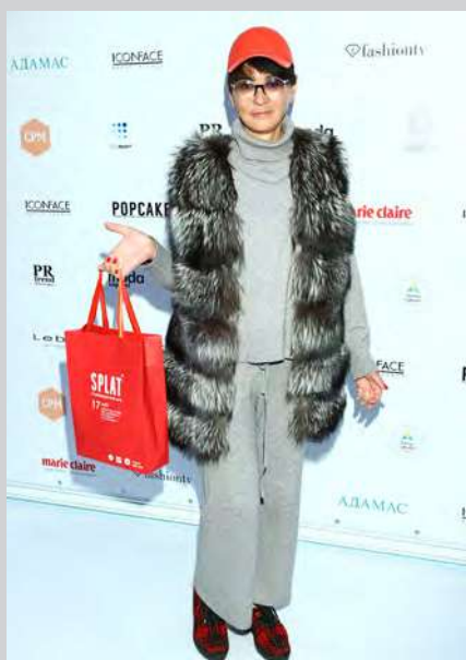
Ирина Хакамада – бизнес-тренер, телеведущая, писатель, публицист

*данная опция ограничена индивидуальным дедлайном