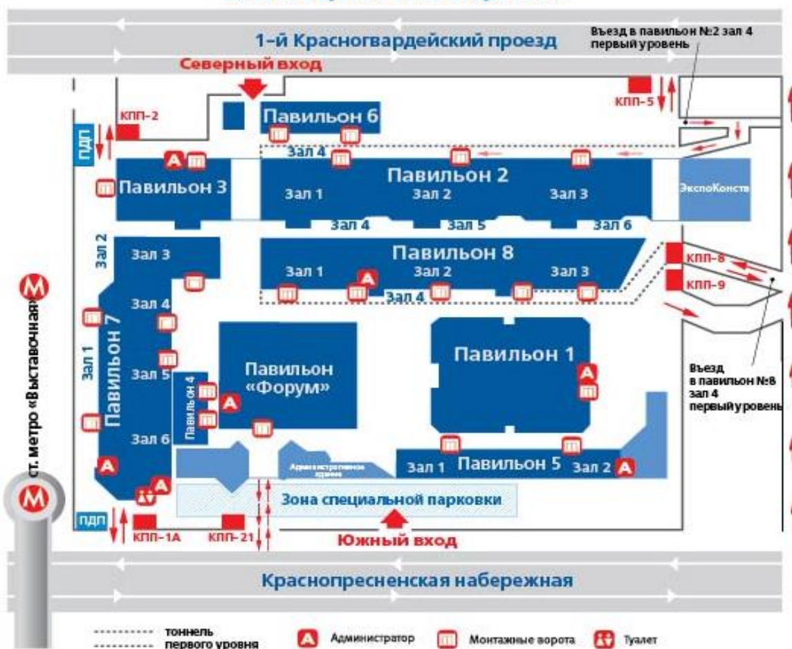
СХЕМА ЦВК «ЭКСПОЦЕНТР»