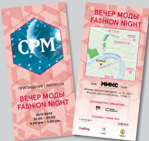
Пример пригласительного билета