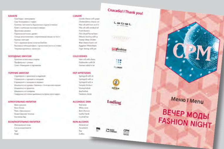
Пример меню клуба