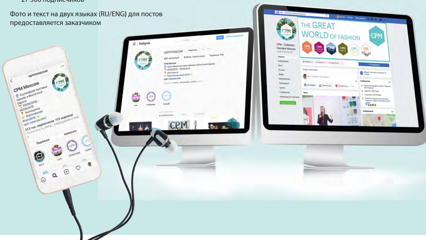
Фото и текст на двух языках (RU/ENG) для постов предоставляется заказчиком