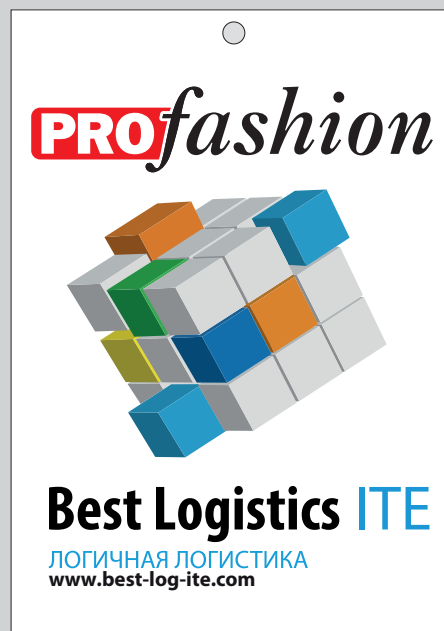
Пример оборотной стороны