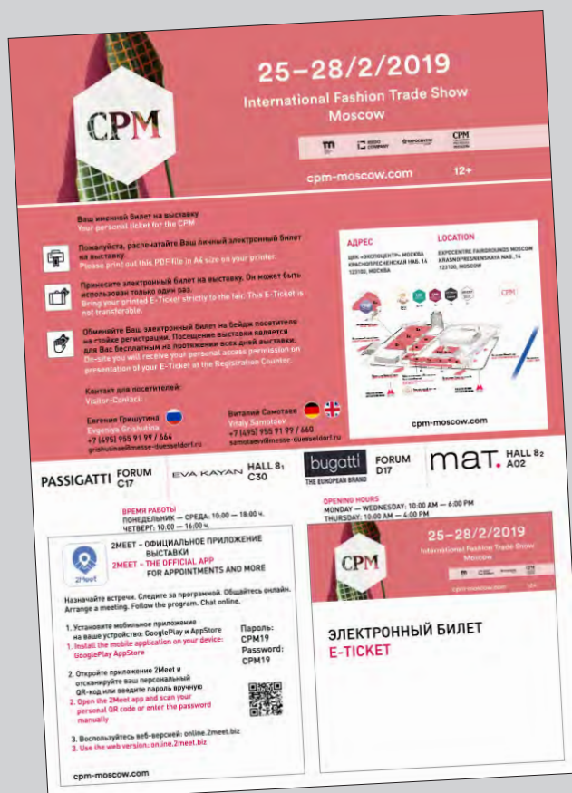
Пример электронного билета