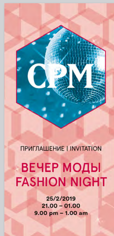
Пример пригласительного билета

Вы можете забрать билеты в Офисе Организаторов (Галерея нижний уровень)