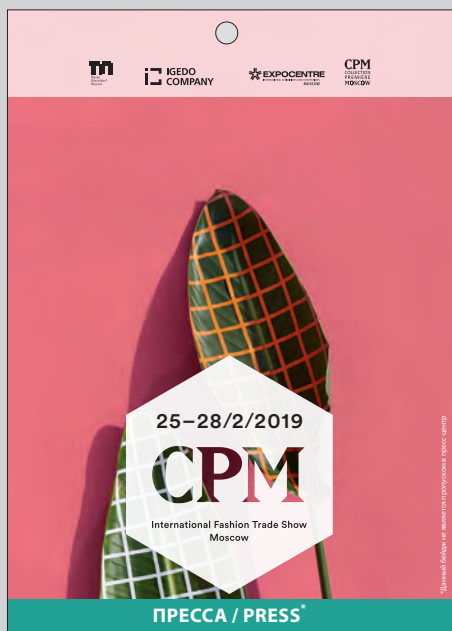
Пример лицевой стороны