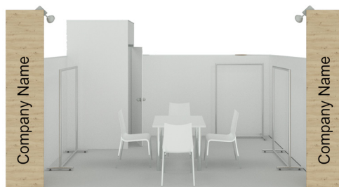
Пример стенда площадью 12 м²

При стандартной застройке не допускаются изменения высоты стен стенда, освещения, цвета коврового покрытия, размещения каких-либо изображений, кроме логотипа компании на колоннах.