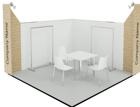
Пример стенда площадью 9 м²